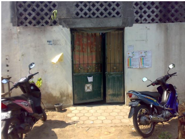
Gb 2. Wisma Roudhatul Ilmi (tampak dari depan)