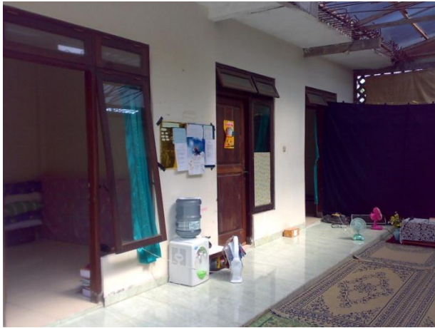
Gb 3. Wisma Roudhatul Ilmi (tampak dari dalam)