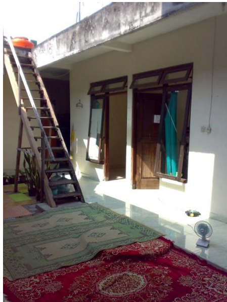
Gb 5. Wisma Roudhatul Ilmi (dari dalam)