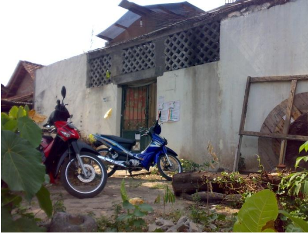
Gb 1. Wisma Roudhatul Ilmi (tampak dari luar)